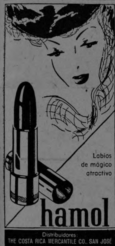
Labios de mágico atractivo

Para el verano SLACKS PARA SEÑORAS Y NIÑOS