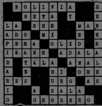
Solución del Crucigrama N° 24.

Vea la solución de este crucigrama N° 25 en nuestra próxima edición.